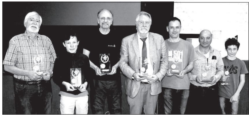
Les vainqueurs des différentes catégories réunis